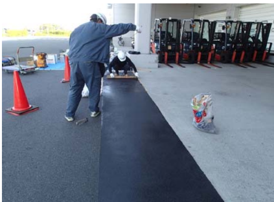
写真1. 荷さばき場段差修正施工状況

アスクリートキット施工事例 アスファルト舗装:アスクリートキットAS コンクリート舗装or半たわみ性舗装:アスクリートキットCO