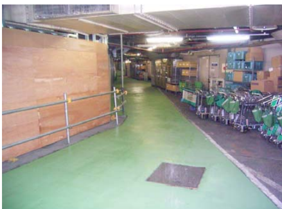
写真5. 通路の改修 ご希望に応じて着色することもできます。