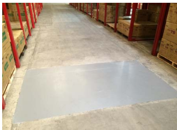
写真4. 倉庫内構造部の破損段差修正 陥没補修にも適用できます。