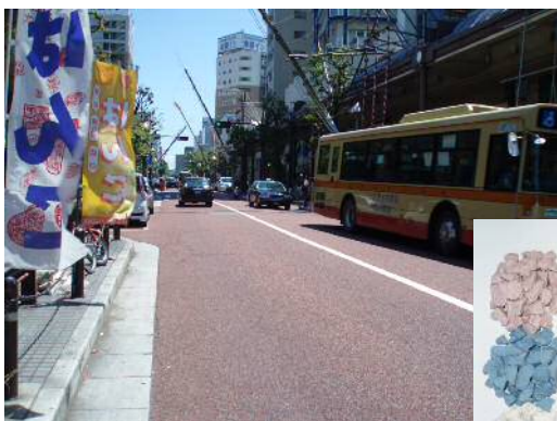
セラサンド (合材工法)