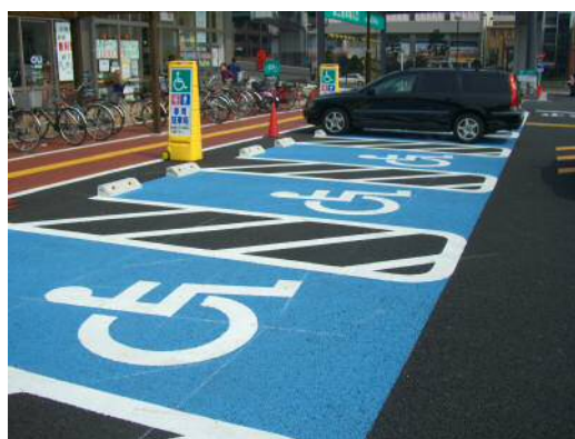
ロードコート FT (塗布型薄層カラー舗装)