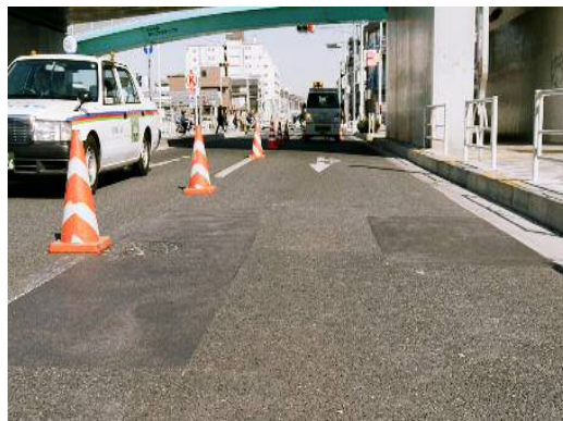
アスクリートキット (舗装補修用)