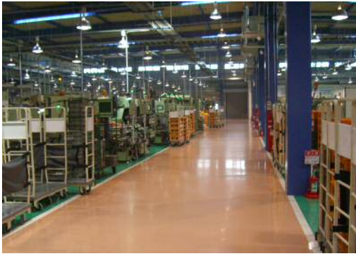
セラレジン ES (樹脂系流し延べ工法)