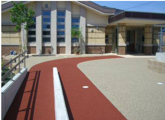
ラバータータン (左) アクアペイブ (右)