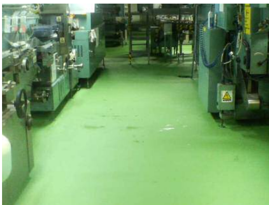
セラレジン BK-C 低臭仕上げ