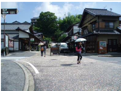
セラサンド (ロード工法)