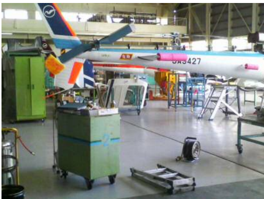
アクアカラー (トップコートセラレジンC)