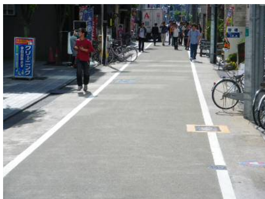
セラグリップクール (遮熱系すべり止め舗装)