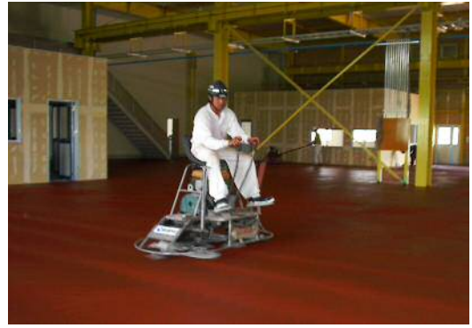
タフコンチール (騎乗式仕様・耐摩耗塗床材)