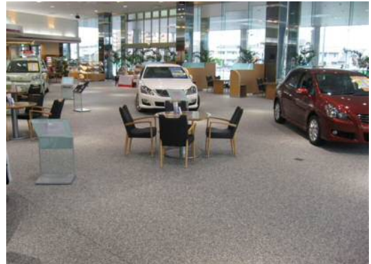
アクアペイブ (車両用・ウレタン樹脂仕様)