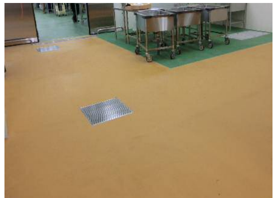
セラレジン UW 防滑仕上げ