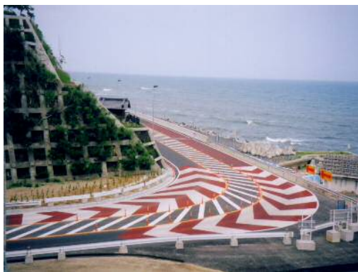
セラグリップ (樹脂系すべり止め舗装)