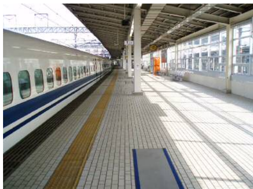
BK タイル (型枠式カラータイル)